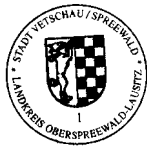
Bengt Kanzler Bürgermeister