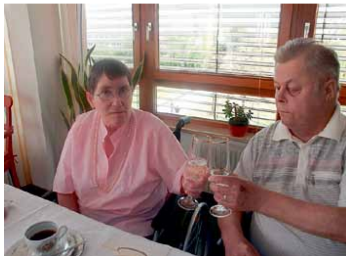
Die Bewohner und Mitarbeiter vom Pflegeheim Vetschau

Das Älter Werden und Sein hat auch seine schönen Seiten. Wir wünschen Ihnen ein langes Leben in Zweisamkeit.